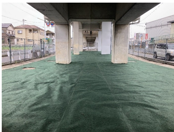
ピン処理に「カメレオンテープ」使用 ※表面がマットと同材の接着テープです