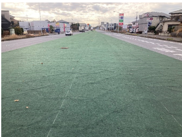
ピン処理に「カメレオンテープ」使用 ※表面がマットと同材の接着テープです