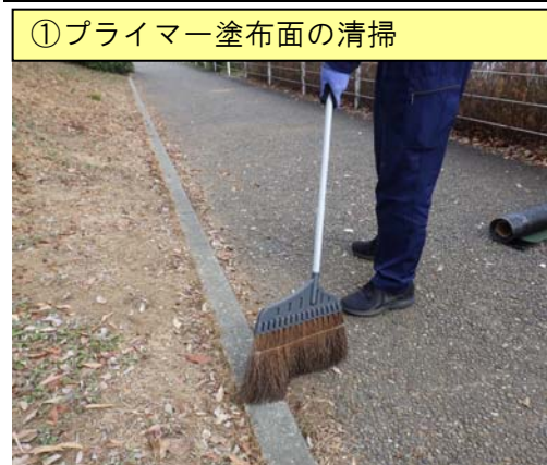
①プライマー塗布面の清掃

水分・砂・ホコリ等を完全に除去します。(除去が不完全ですとプライマーの性能が低下します。)