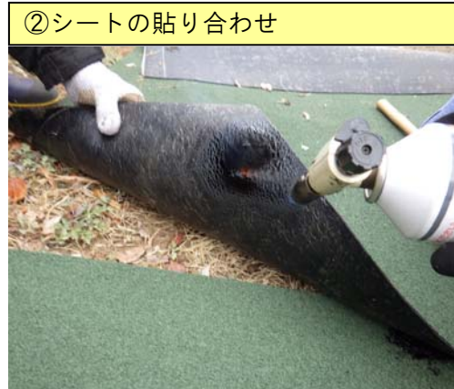
②シートの貼り合わせ

シートを 10cm 重ね合わせ、下側にくるシート表面の保護砂部分をバーナーで炙ります。