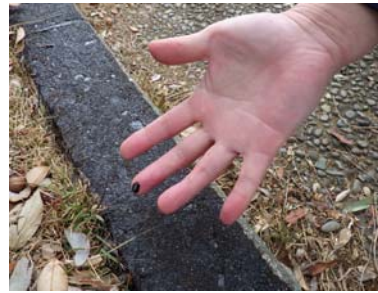
プライマーが手に付く