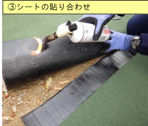
③シートの貼り合わせ