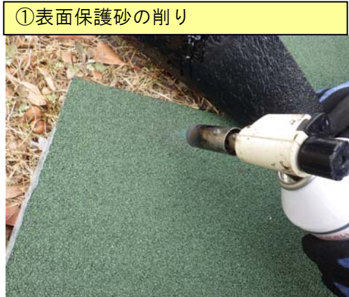
①表面保護砂の削り

シートを 10cm 重ね合わせ、下側にくるシート表面の保護砂部分をバーナーで炙ります。