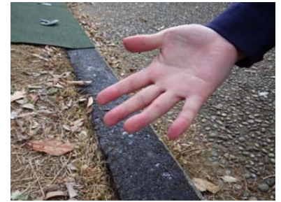
プライマーが手に付かない