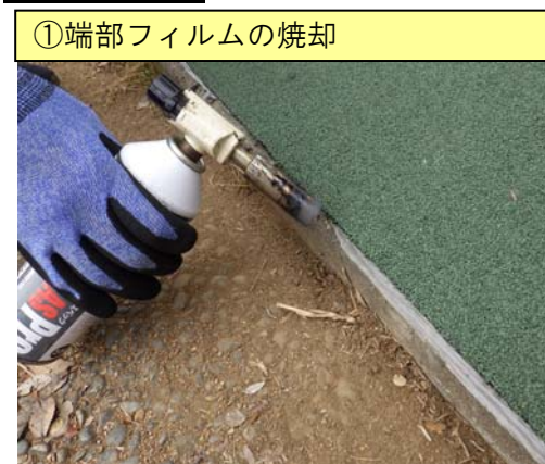
①端部フィルムの焼却