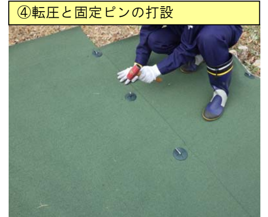
④転圧と固定ピンの打設

溶着箇所をハンマーやローラーで転圧後、重ね合わせ部の上から 50cm ピッチで固定ピンを打設します。