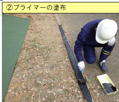
②プライマーの塗布

水分・砂・ホコリ等を完全に除去します。(除去が不完全ですとプライマーの性能が低下します。)