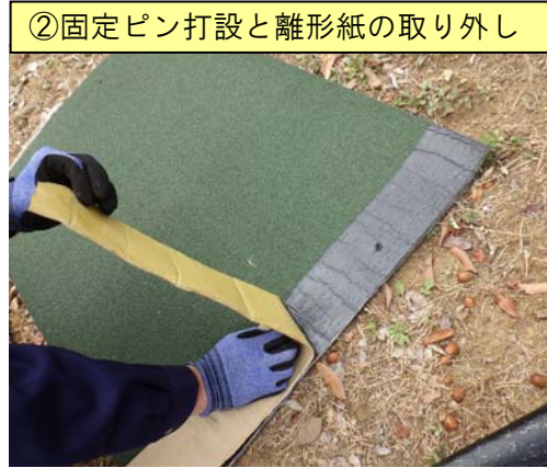
②固定ピン打設と離形紙の取り外し