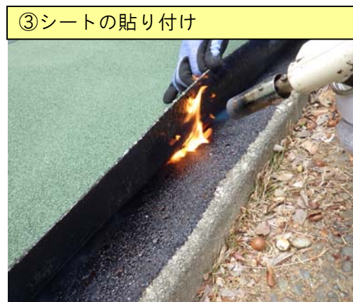
③シートの貼り付け

厚塗り・薄塗りに注意し、均一に専用プライマーを塗布した後、十分にプライマーを乾燥させてください。